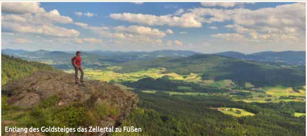
Entlang des Goldsteiges das Zellertal zu Füßen